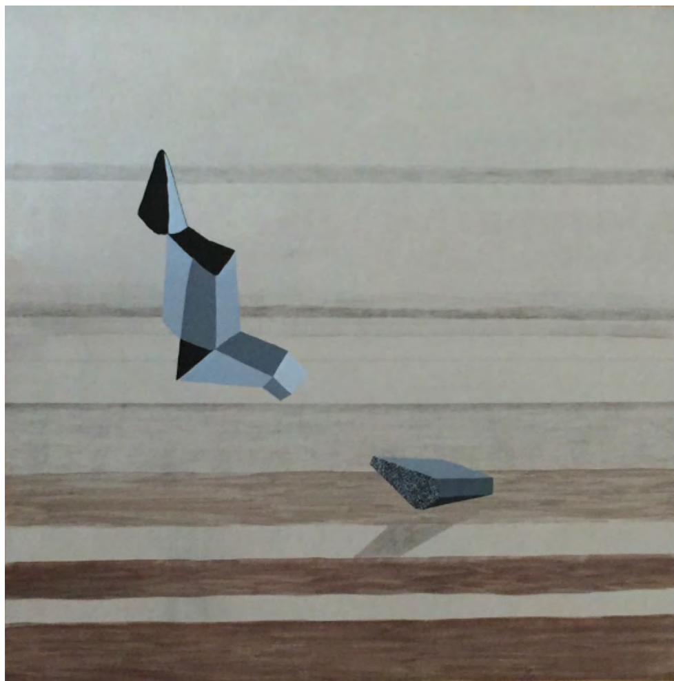
Montserrat Gómez-Osuna Sin título , 2015. Óleo sobre aluminio, 100 x 100 cm.