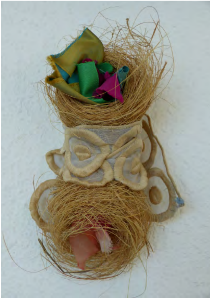
Ángela Nordenstedt Paquetito Nº 0 , 2015. 10 x 20 x 7 cm.