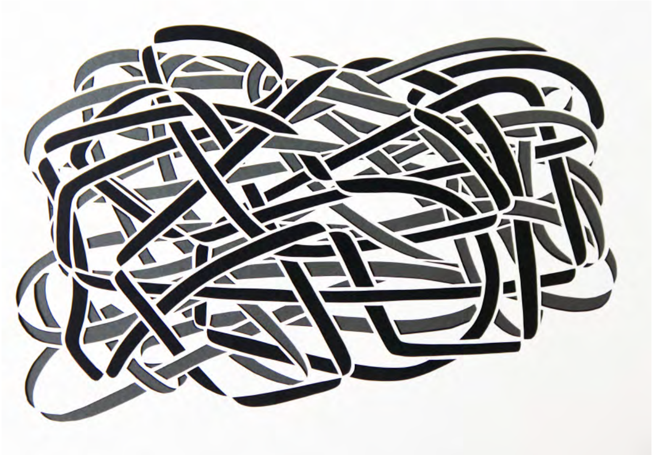
Sandra Rein Lío entre ramas , 2015. 51 cm x 35 cm