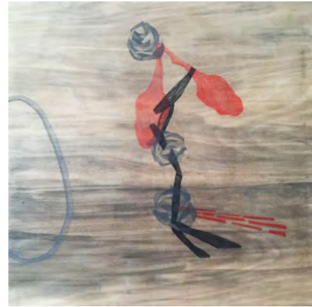
Montserrat Gómez-Osuna. Sin título , 2011. Técnica mixta sobre tabla. 150 x 150 cm.

De manera progresiva Gómez-Osuna ha ido prescindiendo de las formas reconocibles, de las referencias a las imágenes identificables fueran estas pertenecientes a lo cotidiano como las referentes a la tradición de la pintura. Su obra ha ido evolucionando hacia lo antinarrativo, utiliza formas difícilmente identificables que remiten a estructuras que germinan y evolucionan sobre la superficie de manera silenciosa, leve, sin imponerse, como en proceso de disolución, desvalidas, precarias, inestables. No hay certezas, o muy pocas, el caos puede irrumpir en cualquier momento, como en la vida, y parece como si la autora lo aceptase con la mayor naturalidad.