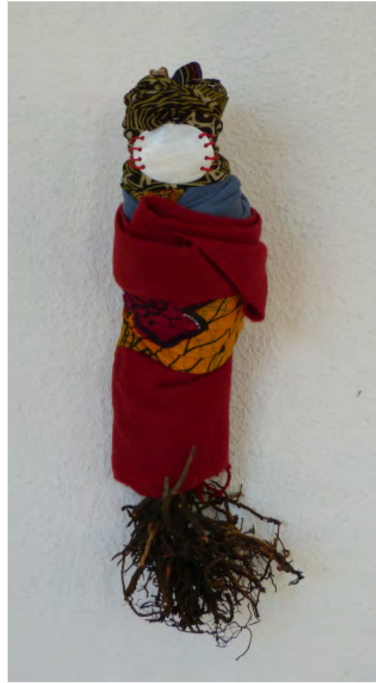
Ángela Nordenstedt Paquetito Nº 64 , 2015. 16 x 36 x 15 cm.