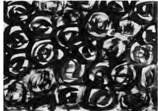
Ángela Nordenstedt ST, 2009. Gouache sobre papel. 42 X 57'5 cm.

Junto al gran muro salpicado de estos personajes A.N. muestra de nuevo obra sobre papel donde vemos desde el trazo gestual a esa especie de naturalezas muertas compuestas por desdibujadas flores marchitas, o sus desnudos “fragmentados”, todos ellos realizados con brea, un material que subraya una voluntaria tosqueidad. Esa traducción de lo imperfecto.