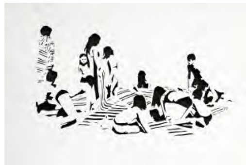
Sandra Rein Escena en la playa , 2015. 50 cm x 35 cm

Una pequeña imagen que representa a un grupo de niños en la playa arropados con toallas de listas precede a los papeles que muestra Sandra Rein . Nombrarlos como papeles parece lo menos comprometido, porque cómo denominarlos... ¿dibujos? ¿collages? Y es que la técnica que utiliza, de entrada, desconcierta. Sus esquemas geométricos —redes, zigzag, curvas y rectas— componen poderosas tramas donde predomina el blanco y negro y, en ocasiones, un rojo intenso. Pero lo que sorprende es que el dibujo, aquello que a primera vista parece trazo depurado, casi exquisito, resulta ser materia extraída. El cutter ha sustituido al lápiz, a la tinta, y de lo que trata cada una de las piezas es del espacio, de ese mínimo territorio que Rein ha dejado entre el recorte de papel y el fondo uniforme, un lugar que de algún modo funciona como abismo.